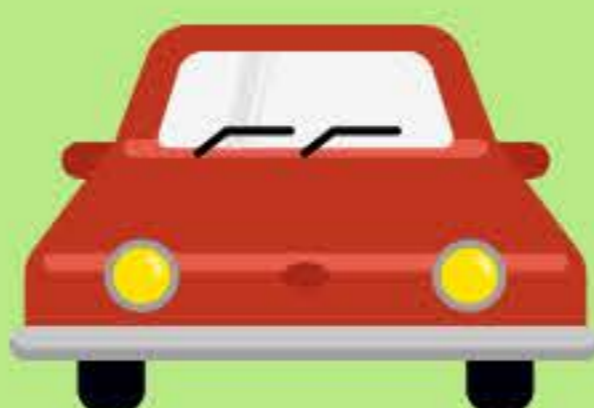
Vehículos y Camiones