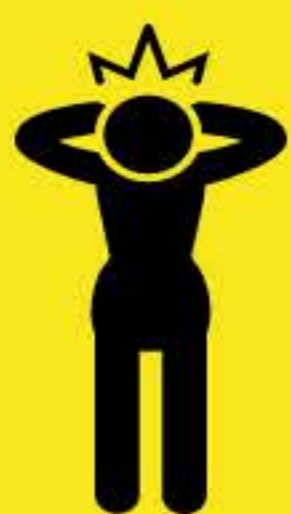
Dolor de cabeza y mareos