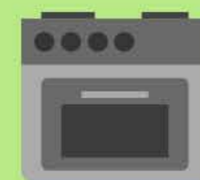
Estufas y Parrillas