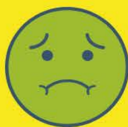
Nausea y Vómitos