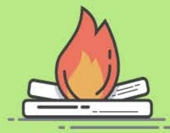
Fogatas y Fogones