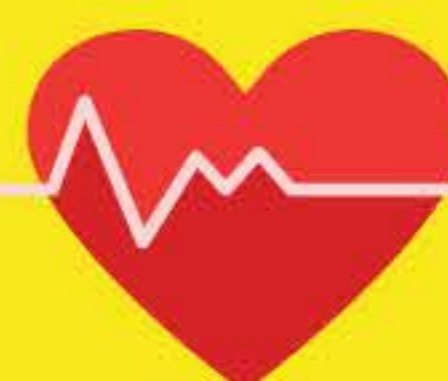
Palpitaciones y Falta de Aire